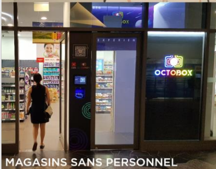
MAGASINS SANS PERSONNEL