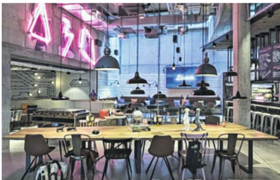
Exemple d'un lobby des hôtels Moxy.

« Mettant l'accent sur le style et non le prix, la marque Moxy Hotels ambitionne de repenser