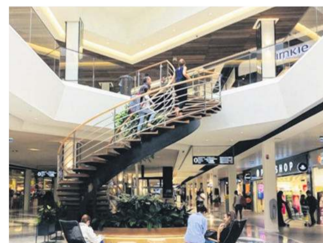
L'enseigne Adopt propose parfum, maquillage et accessoires de mode.

Il y a du nouveau au centre commercial V2 de Villeneuve d'Ascq, dans la métropole de Lille (Nord). Une boutique féminine vient en effet d'ouvrir ses portes : Adopt'.